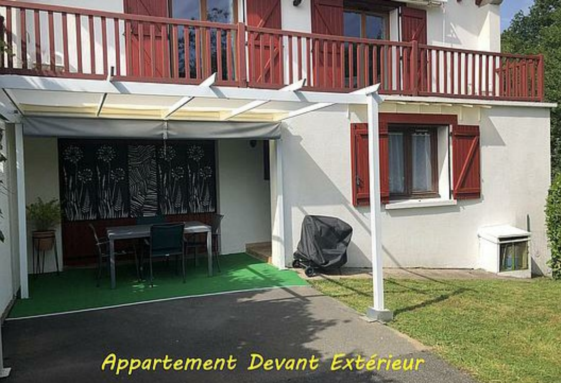
Appartement Devant Extérieur