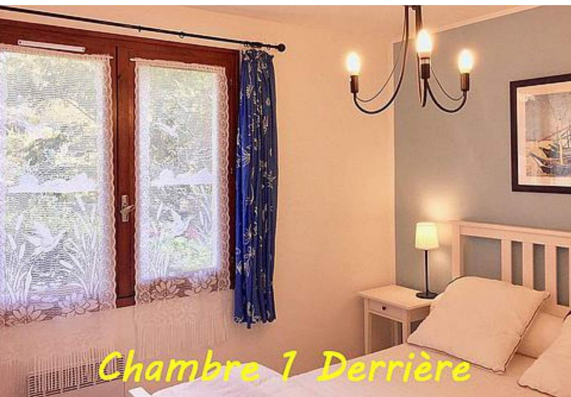
Chambre 1 Derrière