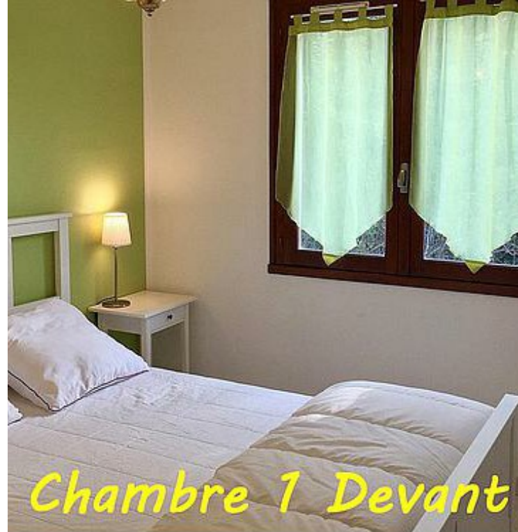
Chambre 1 Devant