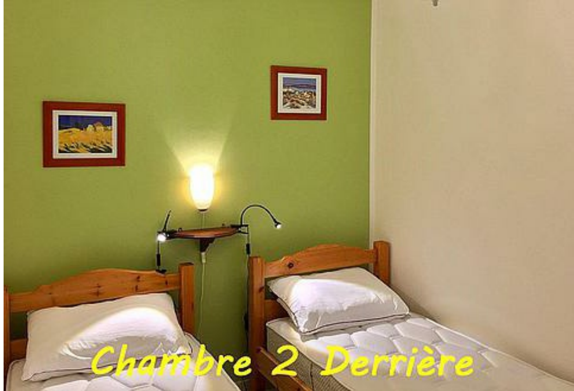
Chambre 2 Derrière