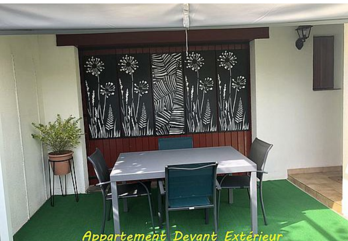
Appartement Devant Extérieur