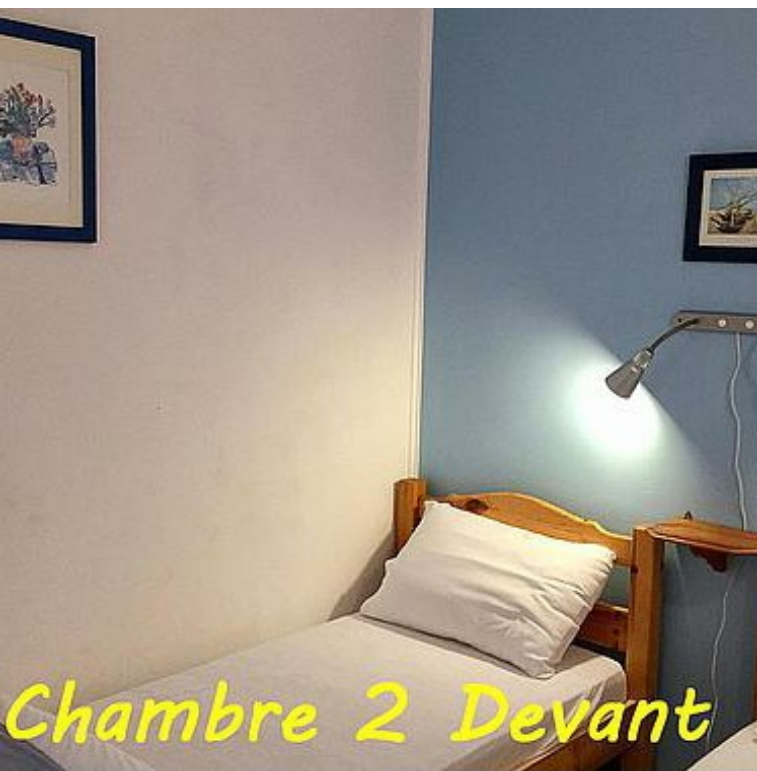
Chambre 2 Devant